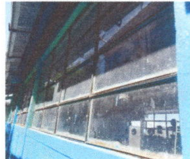
Foto 10: Fabricación e instalación de balcones de hierro en ventanas