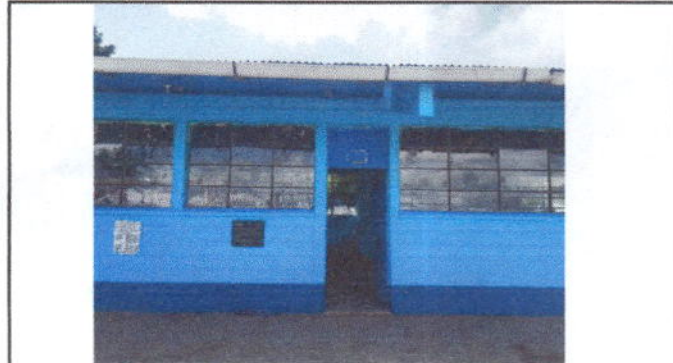
Foto 2: Fabricación e instalación de balcones de hierro en ventana